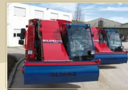
Компактные размеры для низких ферм. Высокопроизводительная фреза, сохраняющая структуру корма.