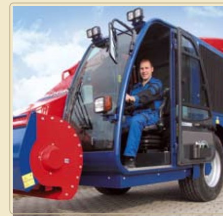
Комфорт начинается с удобной посадки в кабину с широким обзором.