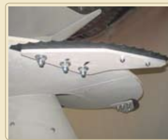
Серийные самозатачивающиеся ножи остаются долгое время острыми, уменьшают энергопотребление и берегут структуру смеси.