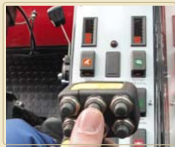
Электрический указатель уровня открытия заслонки, для контроля, подаваемого корма.