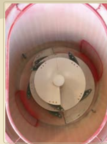
Турбошnek с дополнительным крылом имеет малое число оборотов. Оребрѐнный бункер тормозит корм и обеспечивает бережное смешивание компонентов.