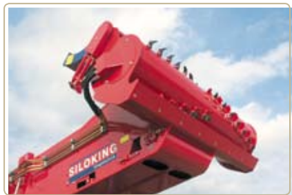
Загнутые ножи, изготовленные из специальной стали, эффективны и долговечны.