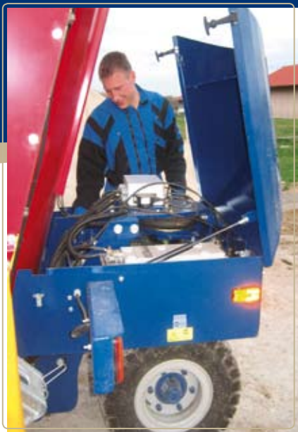
Аккумуляторные батареи располагаются в недоступном для воды корпусе.

Техническое обслуживание осуществляется одним человеком. Двигатель и все места смазки располагаются в легкодоступных местах, уровень масла в гидравлической системе контролируется с помощью контрольного окошка. Радость при езде и радость при обслуживании.