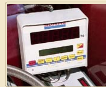
Взвешивается только тот материал, который находится в бункере. Серийные программируемые весы точно сохраняют рацион.