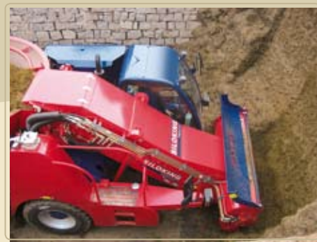
Двигатель располагается по центру машины. Это уменьшает расстояние до рабочих органов, повышает КПД машины и экономит топливо.

Техническое обслуживание осуществляется одним человеком. Двигатель и все места смазки располагаются в легкодоступных местах, уровень масла в гидравлической системе контролируется с помощью контрольного окошка. Радость при езде и радость при обслуживании.