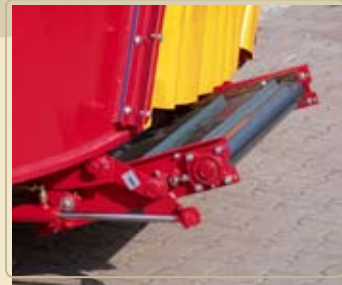
Различные варианты транспортёров, для подачи на более дальнее расстояние и для заполнения высоких кормушек.

В случае поломки, вы получите компетентный ответ, а также информацию о ближайшем сервисном центре, позвонив по номеру нашей круглосуточной горячей линии. Уроки вождения и компетентное консультирование являются дополнительными предпосылками для вашего успеха.