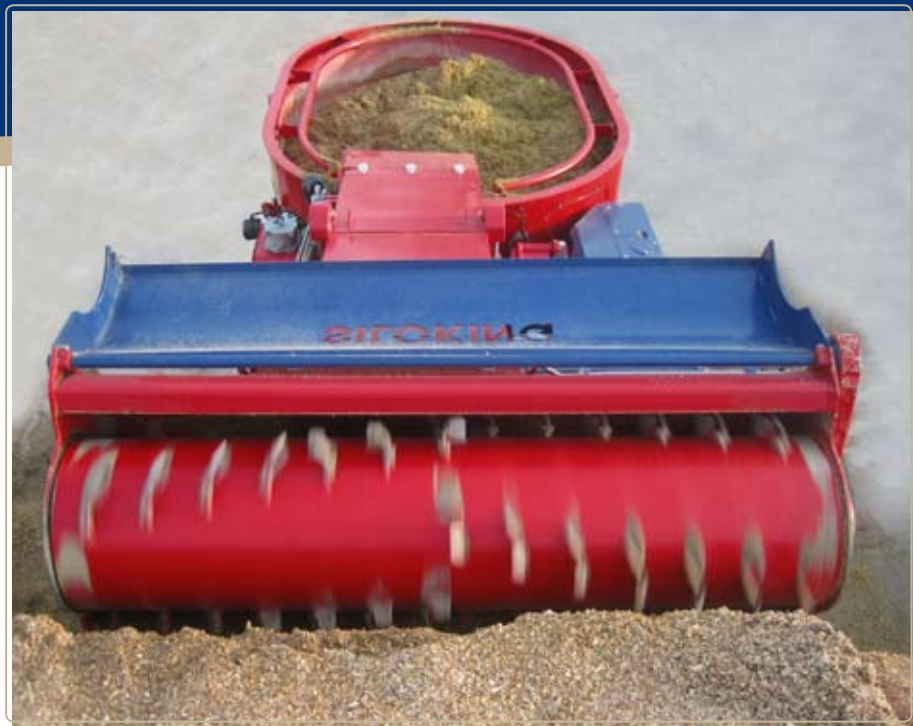
Встроенные лопатки перемещают корм к центру и подают на особо широкий транспортёр.

Это просто логично, что с фрезой SILOKING материал отбирается, не только бережно, но и быстро.