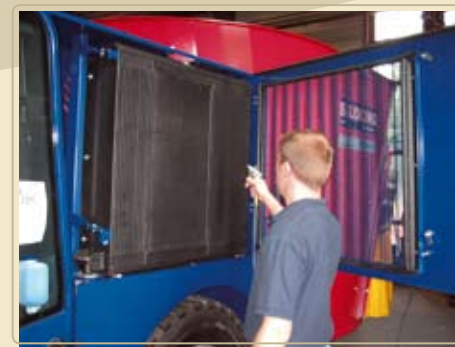
Легкодоступные радиаторы для охлаждения воды и масла расположены друг напротив друга.