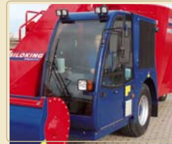
Климатконтроль, увеличивающий комфорт при работе.