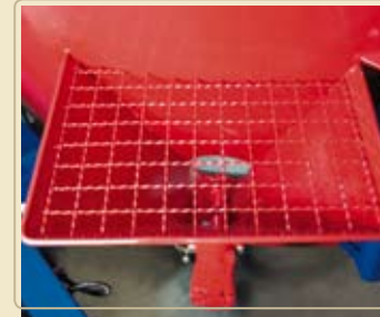
Активный дозатор с подающим шнеком, для ввода минеральных добавок, мелассы или других сыпучих компонентов.