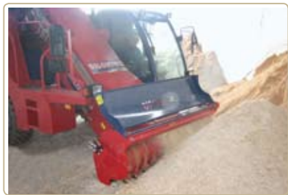
С помощью фрезы возможна точная и чистая загрузка сыпучих материалов.