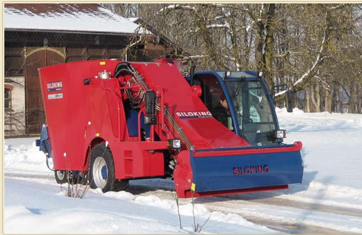
При заказе зимнего пакета, на машину устанавливается предпусковой прогрев двигателя и гидравлики, который работает от сети 220 В. При этом отпадает необходимость в прогреве двигателя.