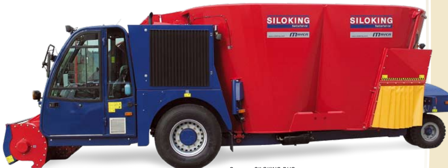
Самоход SILOKING DUO

обслуживания». Благодаря эргономичному дизайну, машина работает как бы сама по себе. Комфорт, который мотивирует любого водителя!