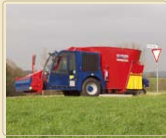
Скоростная версия с 40 км/ч пакетом, для частых и быстрых переездов между различными фермами.