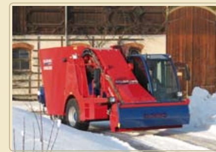
Трёхточечное шасси для лёгкого маневрирования. Оптимальная проходимость даже в зимних условиях.