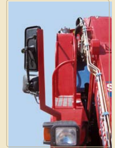
Автоматический привод правого зеркала, легко нажав кнопку в кабине...