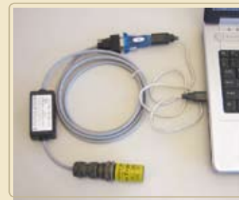
Передача данных, собранных весами, на ПК.