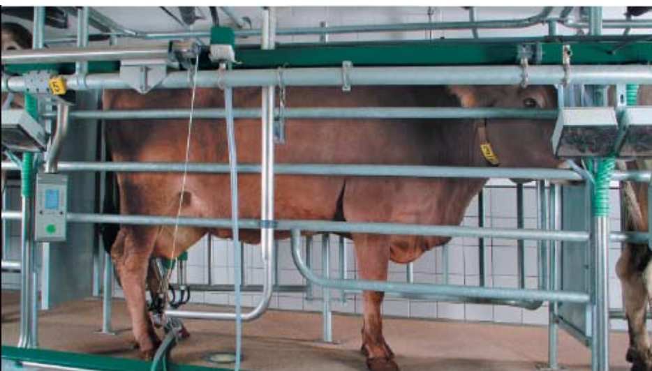
Доильный бокс АвтоТандем